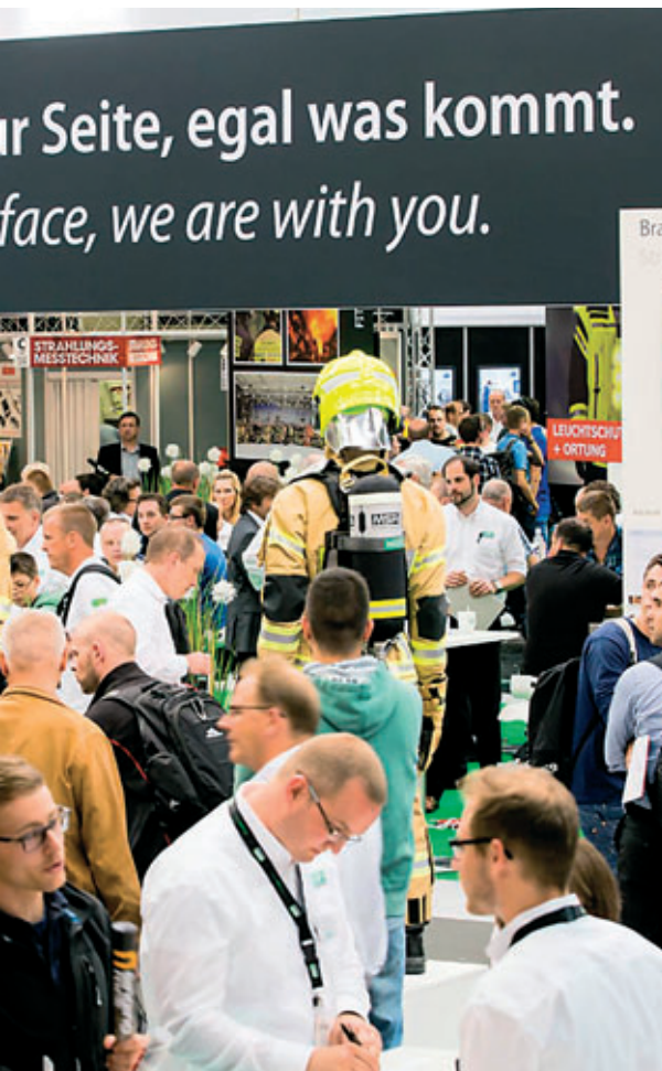
MSA auf der Interschutz 2015: In voller Montur standen Feuerwehrmänner auf den Podesten.

In the first part of the stand , the focus was on missions in tunnels or confined spaces: Here, MSA exhibited its new products for circulation and respiratory protection and its equipment for extended missions – in confined spaces, for example. Visitors were also able to try out winches, lifelbelts and safety harnesses. So what do rescuers come out with when a fire alarm goes off? This could be seen in the second part of the stand, where firefighters stood on platforms in full kit – complete with fire service seats with recesses for the breathing apparatus on their backs. In the third part of the stand there were gas detectors featuring completely new technology. A further highlight was the helmet wall with the new Gallet F1 XF helmets. A raffle was held daily for these. “The stand was everything trade visitors to the stand would have wished for. They were able to examine the products, try them out and talk shop,” says Martina List, Marketing Manager at Bruns Messe- und Ausstellungsgestaltung GmbH, which came up with the idea for the stand ( www.brunsmessebau.de ). JK ■