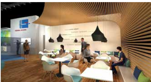
Die Lounge in Holzoptik symbolisiert die Bodenständigkeit und das Traditionsbewusstsein von Rehm Thermal Systems

Ein Messeauftritt lebt vom gemeinsamen Erfahrungsaustausch! Nutzen Sie unsere neue Lounge – sie ist für Ihr individuelles Gespräch mit unseren Experten vorgesehen. Durch die Holzelemente wirkt der Bereich bodenständig und traditionell – dies spiegelt gleichzeitig die regionale Verbundenheit der Firma Rehm.