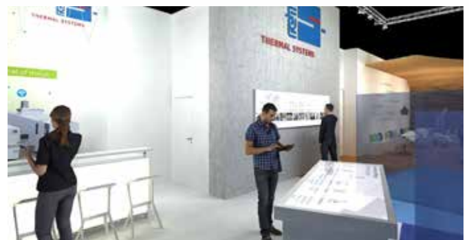
Das moderne, offene Standkonzept mit Elementen aus Beton und LED-Beleuchtung steht für modernen, soliden Maschinenbau